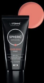
COVER BEIGE OPAQUE