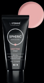
LIGHT PINK OPAQUE