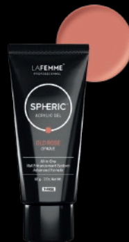
OLD ROSE OPAQUE