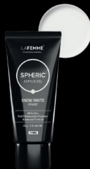
SNOW WHITE OPAQUE