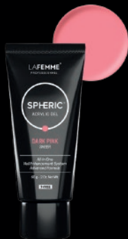
DARK PINK SHEER